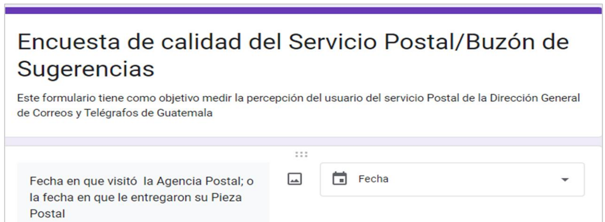
Imagen 1: Formato de la boleta digital

La Dirección General de Correos y Telégrafos presenta reportes estadísticos de la pertenencia étnica de los beneficiarios del servicio postal y desde el mes de septiembre del 2022 se implementó una encuesta digital, la cual tiene como objetivo medir la valoración del servicio postal que tiene el usuario, así mismo dicho instrumento recopila información de la pertenencia sociolingüística de los usuarios del servicio postal, recopilando información del sexo y edad de las personas, su pertenencia étnica y la comunidad lingüística a la que pertenecen, refiriéndose a los idiomas reconocidos por la Ley de Idiomas Nacionales. A continuación se presenta el segmento de la boleta donde se registra información de la pertenencia sociolingüística.